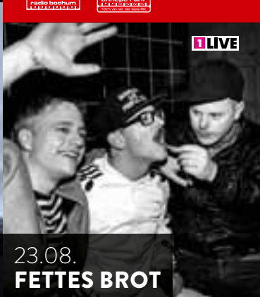
23.08. FETTES BROT

Seit 28 Jahren gibt es nun boSKop – das Kulturbüro des AKAFÖ. Und seitdem macht die studentisch orientierte Einrichtung Kultur, an den Hochschulen und in Bochum, laut und leise, für jeden und für spezielle Interessen. Ob Newcomer Festival oder internationaler Austausch, ob Lesung oder Party, boSKop hat für alle was. Wer selbst mal mitmachen will, ist auch herzlich willkommen: Bei der Jazz-Session, bei der Open Stage beim Bluesabend, als Band beim CampusClub oder bei Kursen zu diversen Themen. Und wer einfach nur genießen will, kommt zum Jazz-Fest, zu Theatertagen oder auch zur boSKop-Show. Und auch bei Bochum Total ist boSKop seit vielen Jahren vertreten. Diesmal beim Campus RuhrComer 2014 (ehemals Newcomer Festival) und mit personeller und inhaltlicher Unterstützung der Wortschatzbühne.