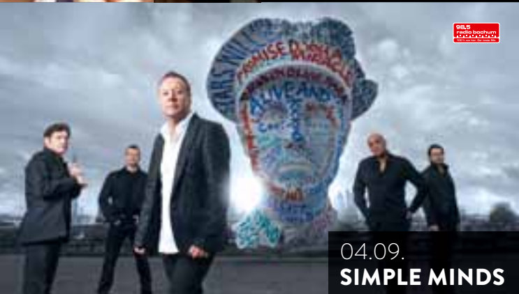
04.09. SIMPLE MINDS

4 98.5 radio bochum radio energie ruhr 100% live aus Bochum