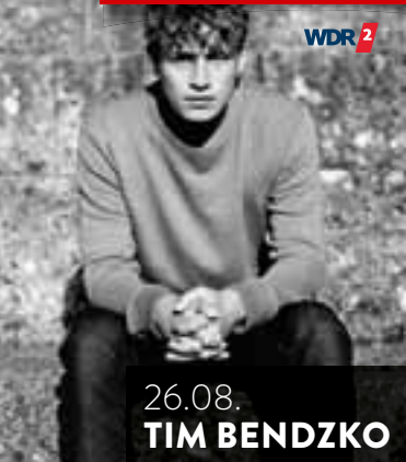
26.08. TIM BENDZKO

SOUNDCHECK - DIE PLATTENBÖRSE GÜNSTIGE GASSENHAUER UND FILME