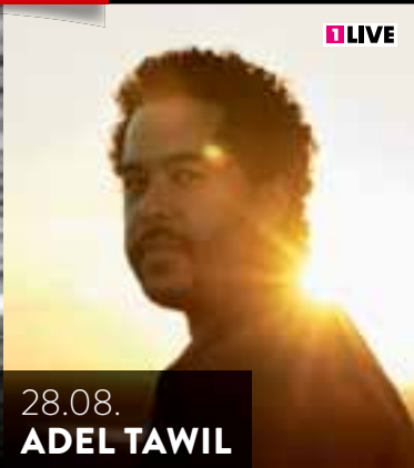
28.08. ADEL TAWIL